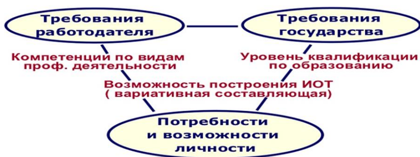
Рис. 4. Задачи ФГОС нового поколения с учетом требований работодателя и государства и потребностей и возможностей личности.

Появляется новое понятие - индивидуальная траектория образования, т.е. результат реализации личностного потенциала ученика в образовании через осуществление соответствующих видов деятельности [2, с. 57].