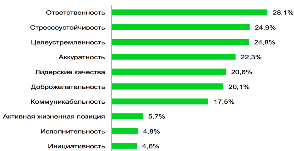
Рис. 3. Основные требуемые личные качества в вакансиях для молодых специалистов.

Основные требуемые личные качества в вакансиях для молодых специалистов представлены на рис.3: