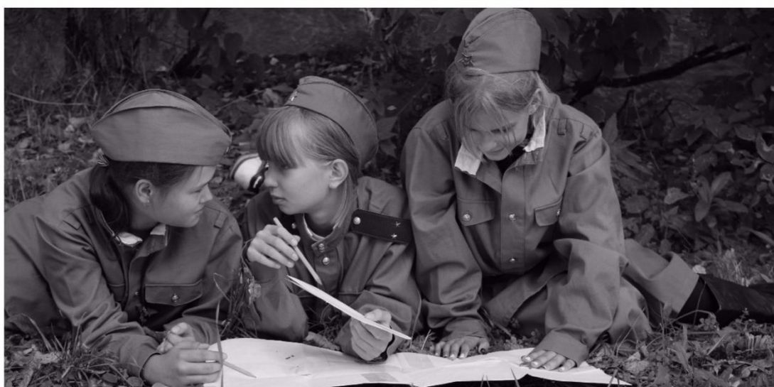
Участники квеста из Свердловской области.

По хештегу #ПисьмаПобеды2017 можно найти фотографии участников квеста серии Всероссийских патриотических акций «Письма Победы» в социальных сетях.