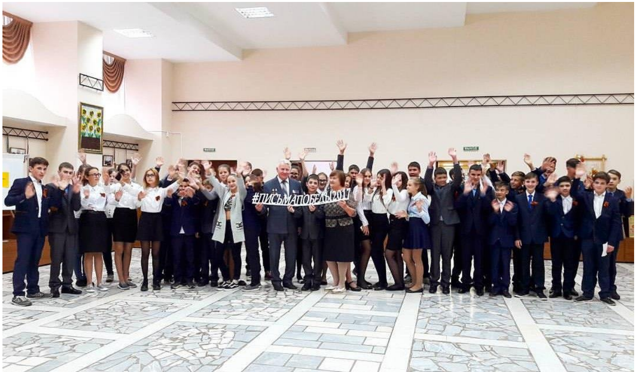
Участники из Республики Татарстан с хештегом Акции.

Одним из мероприятий серии Всероссийских патриотических акций «Письма Победы» стало составление молодежью «писем в прошлое» членам своих семей, принимавшим участие в событиях, связанных с Великой Отечественной войной 1941-1945 годов. Авторам писем было предложено описать свой вклад в сохранение памяти о Великой Победе советского народа над фашистской Германией и ее союзниками. Любой желающий мог написать «письмо в прошлое» и выразить свою благодарность участникам Великой Отечественной войны.