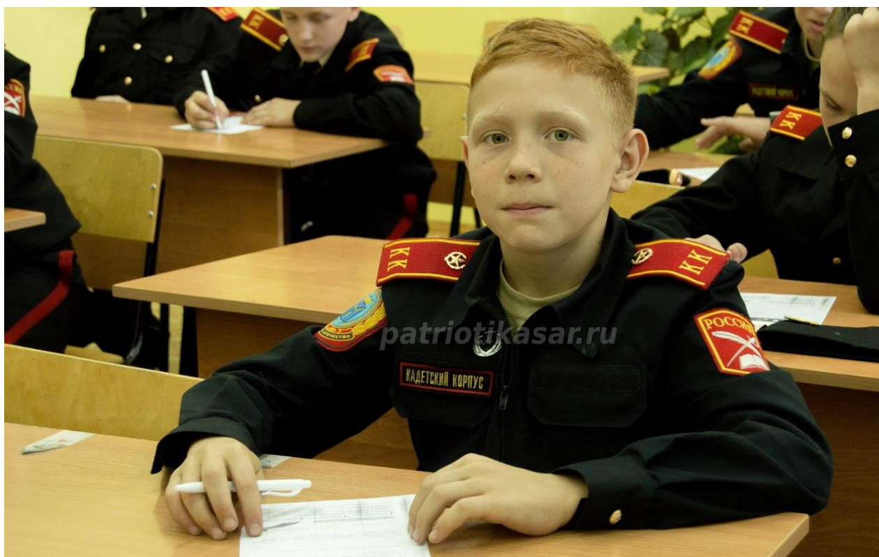
Участник Акции пишет письмо участникам Великой Отечественной войны, Саратовская область.